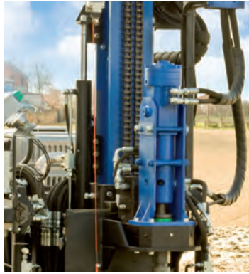
Particolare rotoperforatore a 2 motori e antenna idraulica allungabile (+2200 mm).

Hydraulic hammer with 2 motors and jib (+2200 mm)