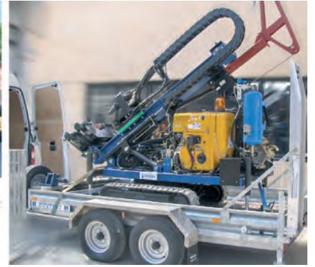
Le dimensioni compatte della perforatrice JOY 1 consentono di trasportarla con un carrello di piccole dimensioni

The small size of these drilling machines allows to move them on a little van