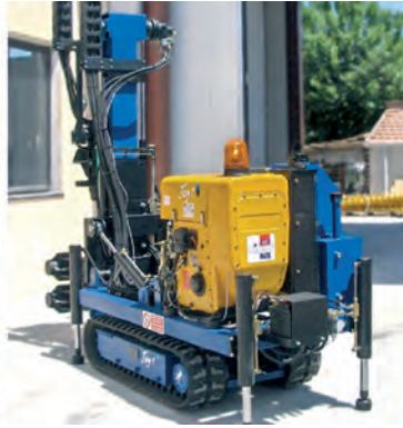
Vista posteriore JOY 1

Hydraulic hammer with 2 motors and jib (+2200 mm)